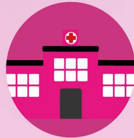
Prevent HAIs (Hospital-Acquired Infections)